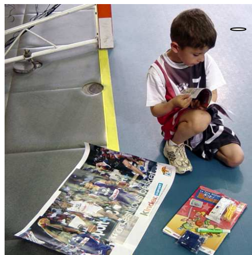
A Feytiat (87), © FFBB