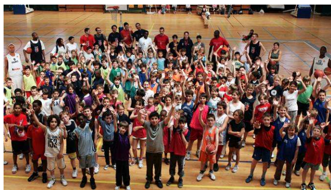
A Paris, © Bellenger/IS/FFBB