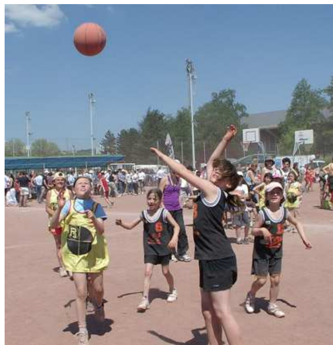
A Saint Etienne (42), © FFBB