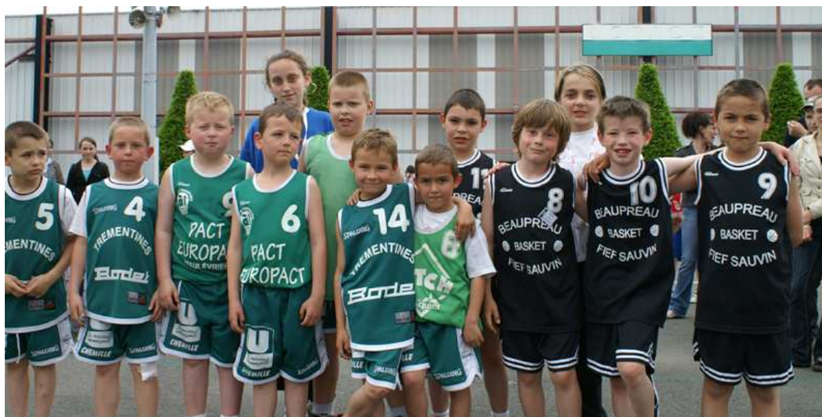
A Cholet (49)