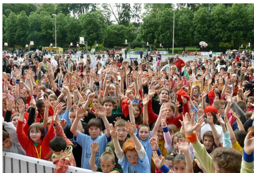
Au Mans (72), © FFBB